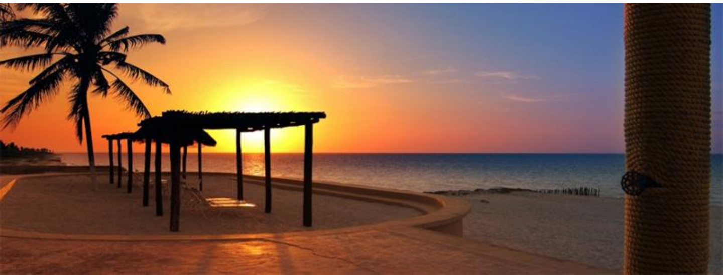
Hotel Reef Yucatán

Prolongación Paseo de Montejo, No. 225 entre 48 y 50, Col. Montes de Amé Edif. Grupo Dicas, Mérida, Yucatán