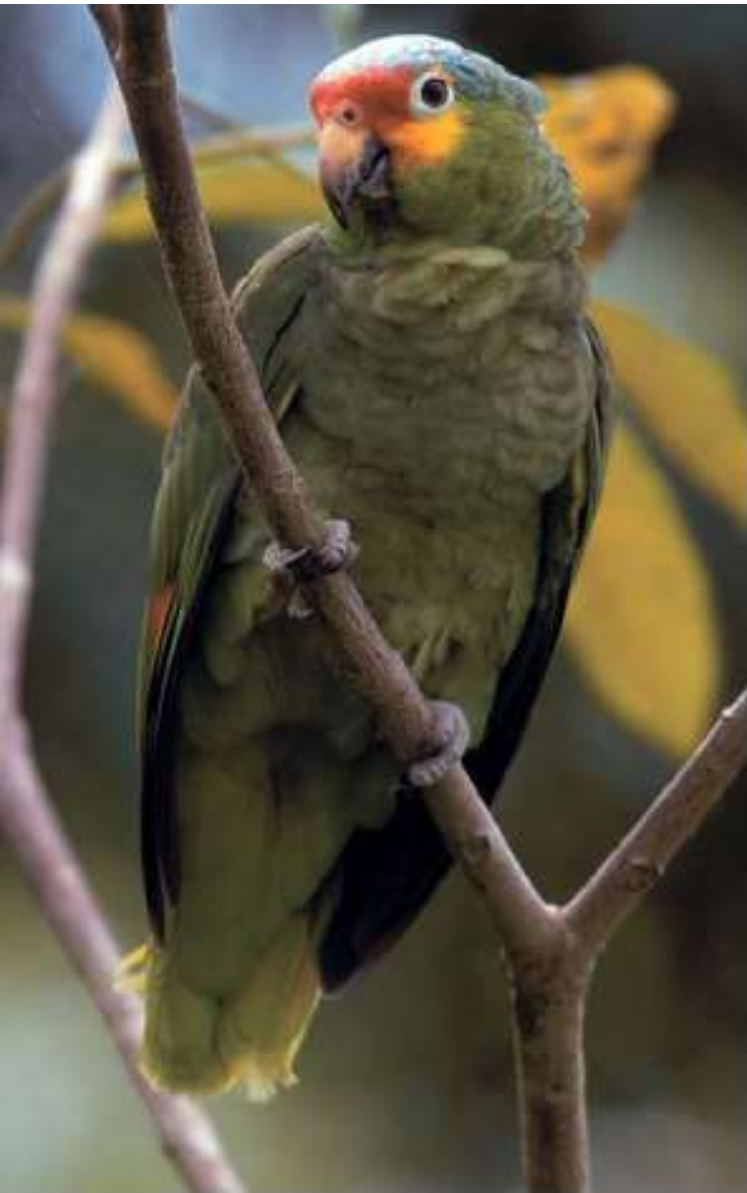
Red-lored Amazon Parrot