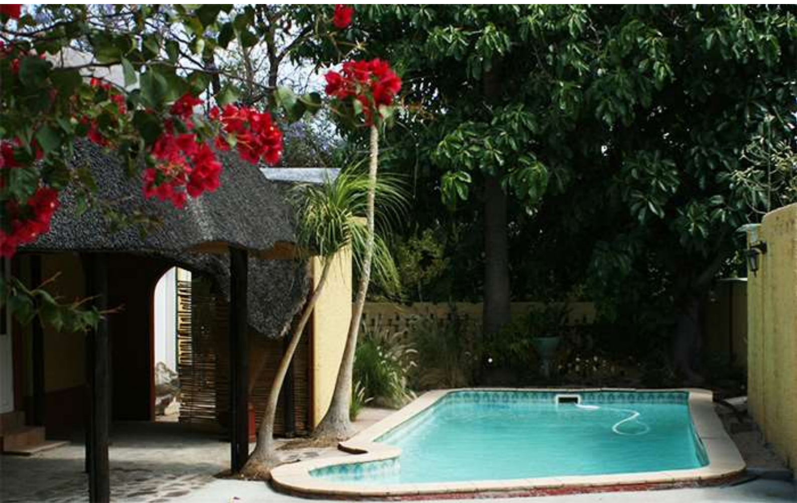
Otjohotozu Guest Farm Omaruru Erongo Namibia Tel: +264 64 570 336