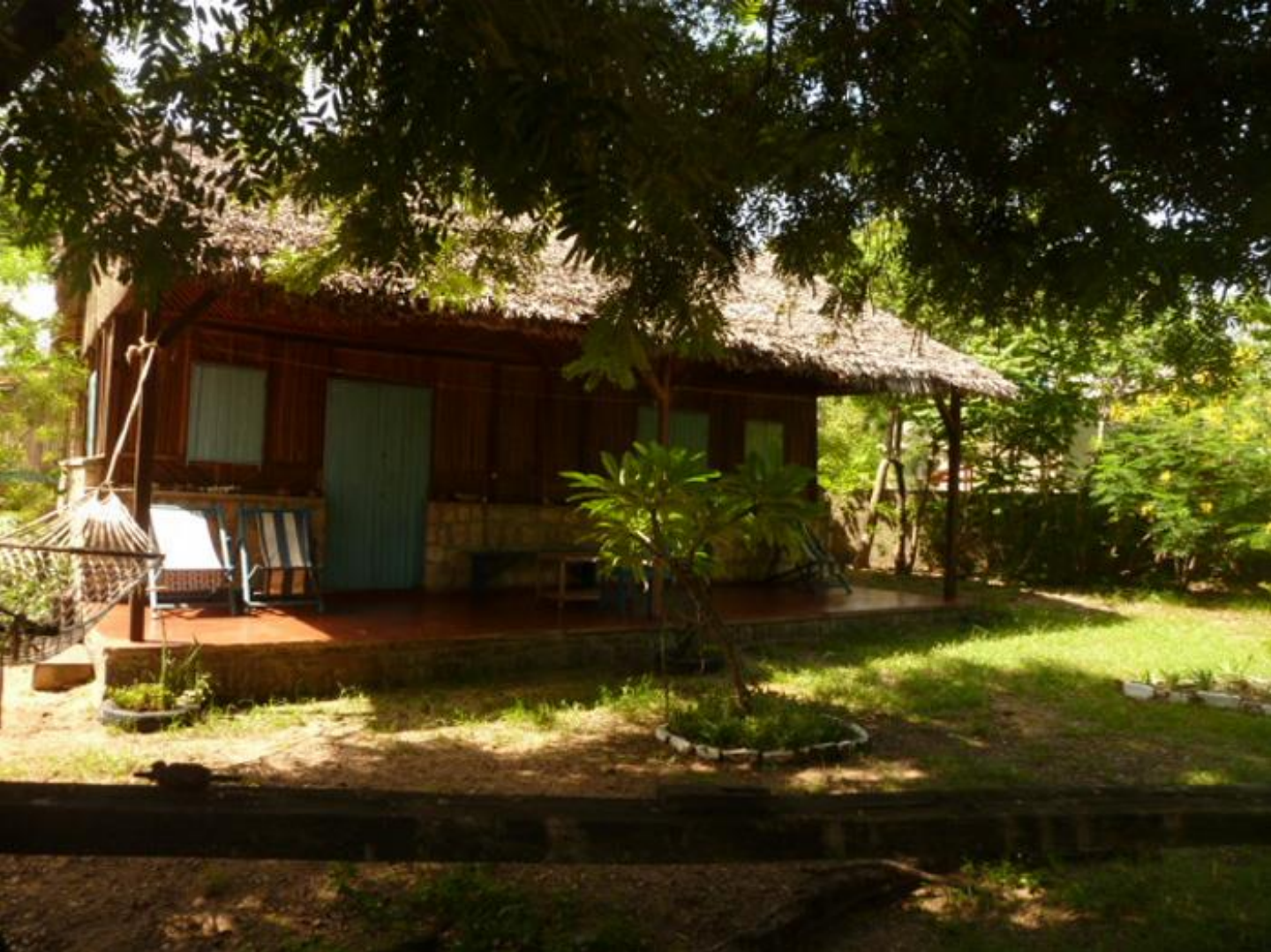
Badamera Hotel Plage de Ramena Diego Suarez/Antsirananana Madagaskar Tel: +261 3476 88313