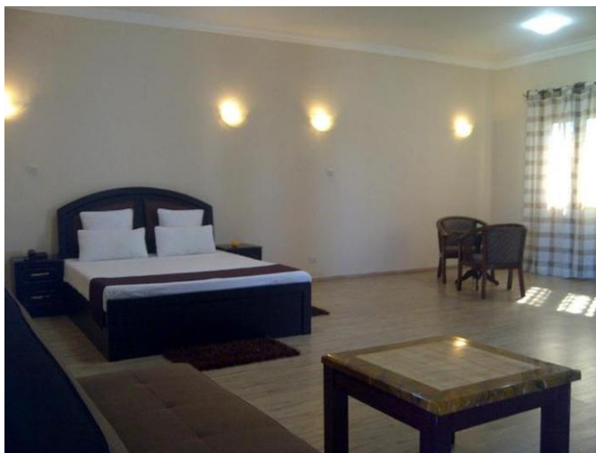
Hotel H1 Antsirabe Antsirabe, Madagaskar Madagaskar