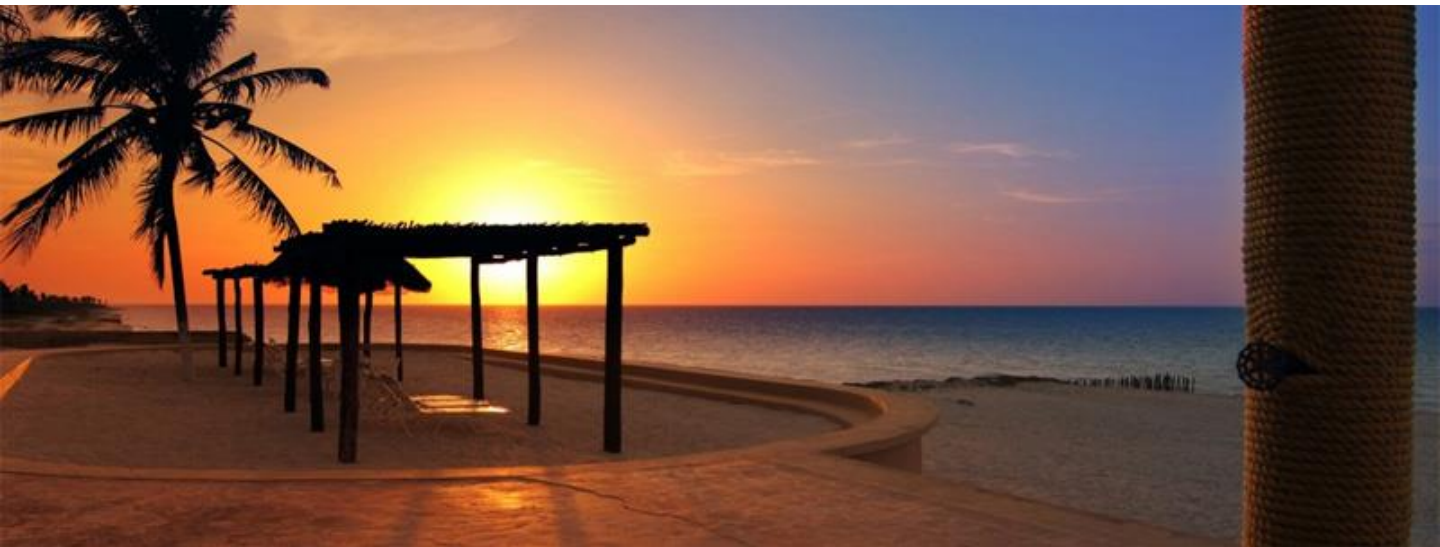
Hotel Reef Yucatán

Prolongación Paseo de Montejo, No. 225 entre 48 y 50, Col. Montes de Amé Edif. Grupo Dicas, Mérida, Yucatán