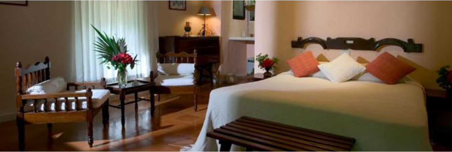
Hacienda Chichen Resort