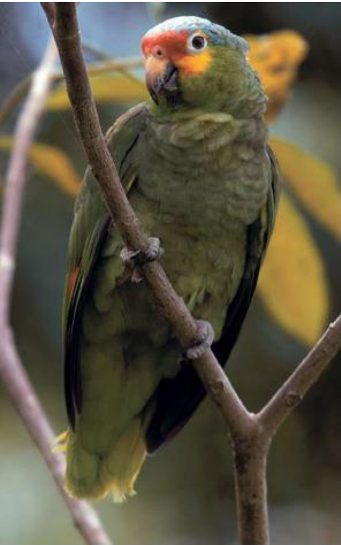
Red-lored Amazon Parrot